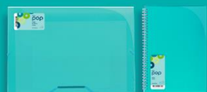
CASE ELASTIC BAND