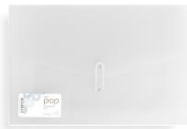
EXPANDING FILE SP