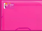
EXPANDING FILE 12P