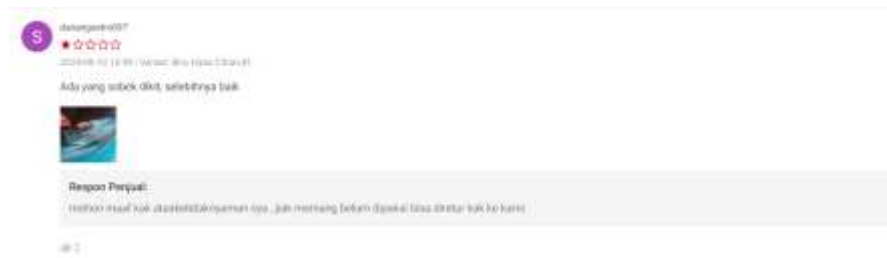
Gambar 3 Review Negatif (1)

Pada pembelian 13 Agustus 2024, atas nama akun danangsetro097 membeli sepatu Ardiles Nfinity Flash Sepatu Running - Biru Hijau Citrus, memberi nilai produk bintang 1 dikarenakan sepatu yang diterima mengalami sedikit sobek pada saat barang diterima.