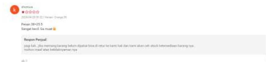
Gambar 4 Review Negatif (2)

Pada pembelian 13 Agustus 2024, atas nama akun danangsetro097 membeli sepatu Ardiles Nfinity Flash Sepatu Running - Biru Hijau Citrus, memberi nilai produk bintang 1 dikarenakan sepatu yang diterima mengalami sedikit sobek pada saat barang diterima.