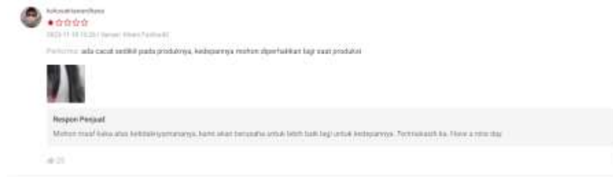
Gambar 5 Review Negatif (2)

Pada tanggal 26 Juni 2023 akun atas nama adidarmaputra968 juga memberikan rating bintang 1 terhadap kualitas pelayanan yang diberikan oleh admin shopee dikarenakan mengalami kesalahan pengiriman warna barang dari yang semula dipesan oleh user shopee tersebut