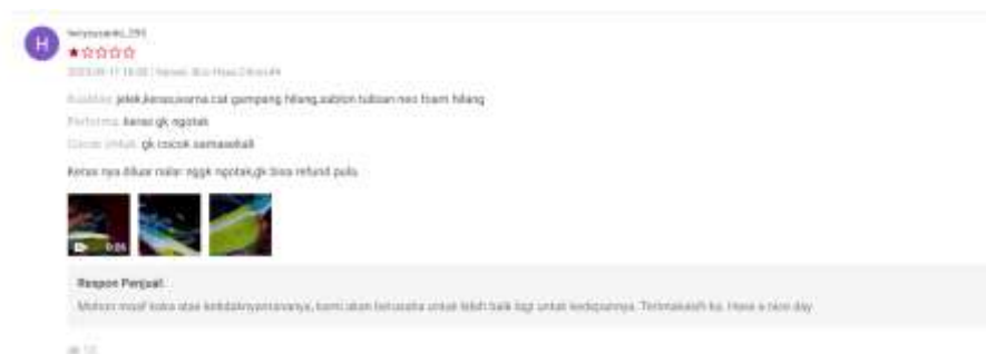
Gambar 6 Review Negatif (2)

Pada tanggal 26 Juni 2023 akun atas nama adidarmaputra968 juga memberikan rating bintang 1 terhadap kualitas pelayanan yang diberikan oleh admin shopee dikarenakan mengalami kesalahan pengiriman warna barang dari yang semula dipesan oleh user shopee tersebut